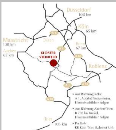
Grafik und Klosterfotos: Kloster Steinfeld

ist Sozialpädagogin, Lehrerin für Achtsames Selbstmitgefühl (MSC), Taiji- und Qigong-Lehrende seit 1990 in eigener Schule. „Bewegte Philosophie“ heißt für mich, mit Körper und Herz zu erspüren und zu erleben, wie daoistische und buddhistische Weisheit mein Leben bereichert.“